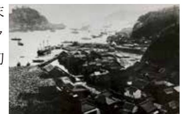
明治時代の浦賀ドック(浦賀船渠)

横須賀製鉄所には、国内最高水準の学校「巒舎(こうしゃ)」が設置され、その「演習図面」や出身者の一部、卒業生提案の「フランス料理フルコース案」を紹介します。横須賀製鉄所の同窓生たちは、浦賀ドック(浦賀船渠)の設立にも貢献しました。昨年末に寄贈を受けた「浦賀ドック貴重写真」も速報展として初めて当館で展示します。