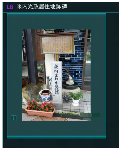
米内光政居住地跡