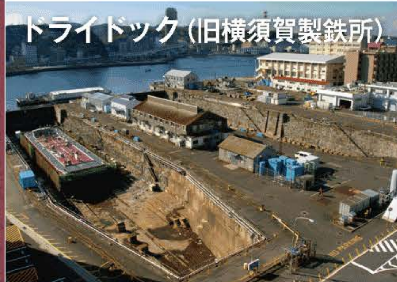
ヴェルニー記念館

日本の近代化をすすめた 小栗。その足跡を今につ たえるゆかりのスポットも あります。