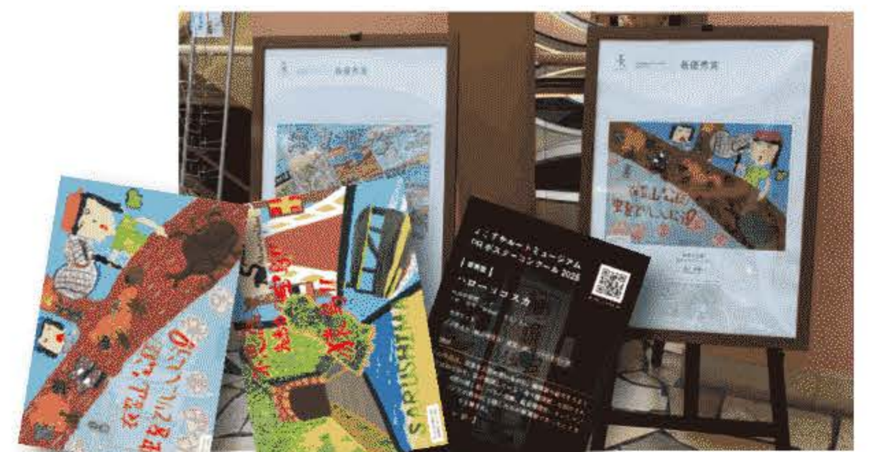
サテライトカード

※コースカベイサイドストアーズ、モアーズなど、たくさんの方が集まる場所でも展示する予定です。