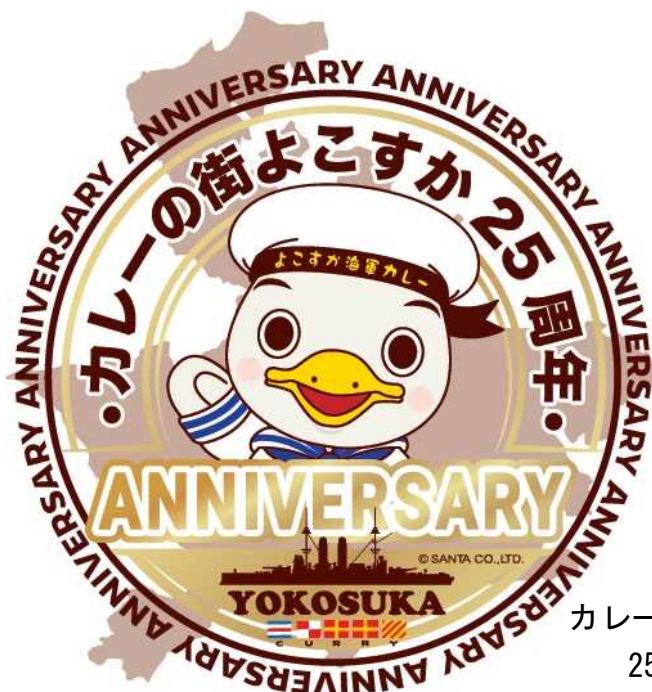
カレーの街よこすか 25周年ロゴ