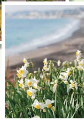
北下浦海岸通りに咲くスイセン