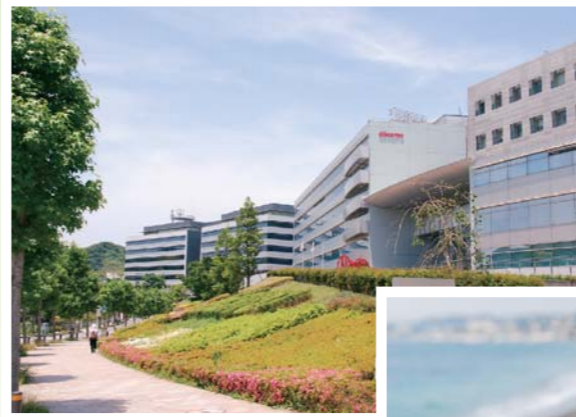
NTT docomo R&Dセンタ