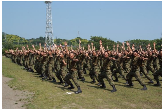
新入隊員の訓練展示