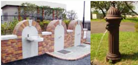
写真左：水飲み場 右：供用栓

水源地内には、「東京湾要塞地帯」と記された戦時中の標柱や、明治年代に作られた供用栓、国登録文化財に指定されている鉄筋コンクリート造浄水池を見ることができます。また、駐車場の脇にある水飲み場で、走水の水を飲むことができます。