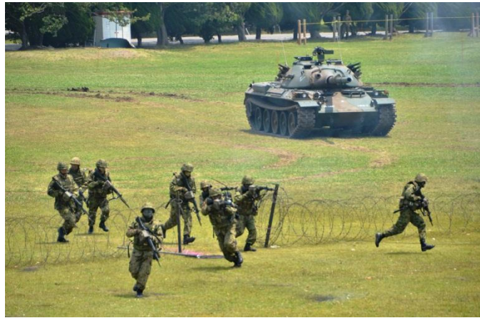
各種アトラクション