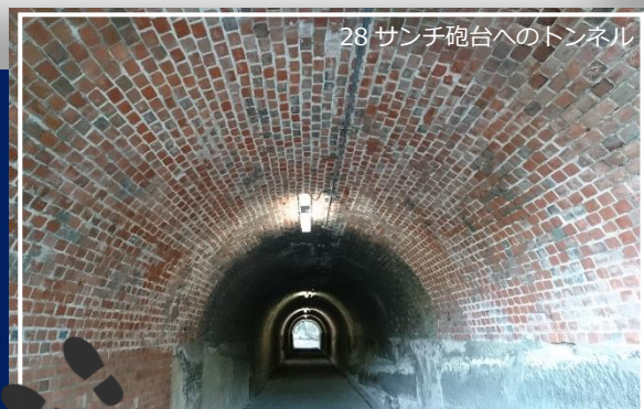
28 サンチ砲台へのトンネル

全国のトンネルを歩き「マツコの知らない世界」などメディアで情報発信中。 各地でトンネルツアーも実施。今春、総務省地域力創造アドバイザーに就任し、 トンネルなど地域コンテンツの磨き上げにも取り組む。