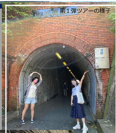
第1弾ツアーの様子