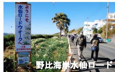
野比海岸水仙ロード