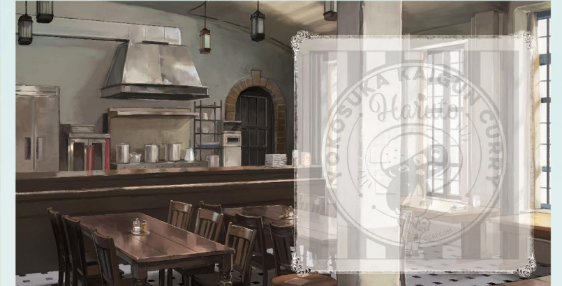
猿島内多目的ホール