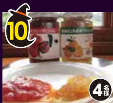
10 三浦半島の 果実ジャム ギフト