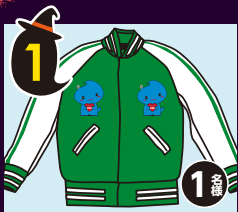
1 スカリン 刺繍入り特注 スカジャン