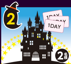
2 東京ディズニー リゾート 1DAYパスポート (大人ペア+小人)