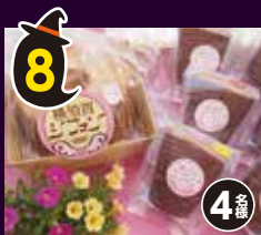
8 シフォンケーキ のセットギフト