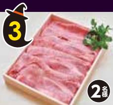
3 葉山牛の 肩ロース ギフト