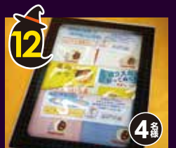
12 海軍カレー デザイン てぬぐいギフト