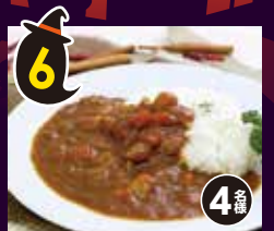
6 よこすか 海軍カレー ギフト