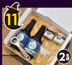
11 横須賀ビール スペシャル ギフト