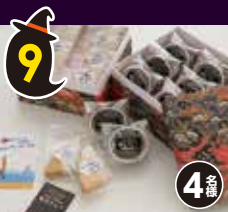
9 焼チョコと クッキーの ギフト