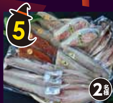
5 三浦半島の 地魚干物 ギフト