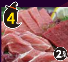
4 天然 本マグロの ギフト