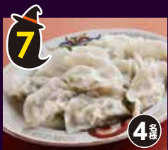
7 海老としらすの 水餃子ギフト