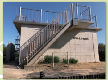
アゼリアハウス (山頂休憩所・展望台) Azalea House Rest Area and Lookout Point